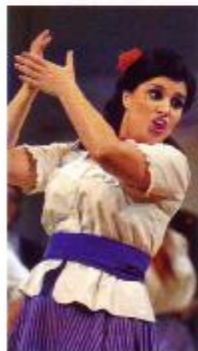
V její nejslavnější roli, Carmen , ji zná celý svět. „Když jsem ji slyšela poprvé, věděla jsem, že ji musím zpívat.“